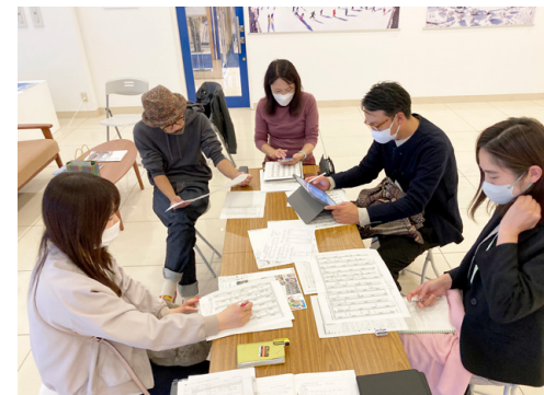
展覧会に向けた打ち合わせ