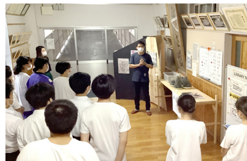
学校での出張展示「ザワメキ school キャラバン」