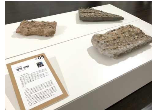
作品の紹介文には支援者や家族のコメントも