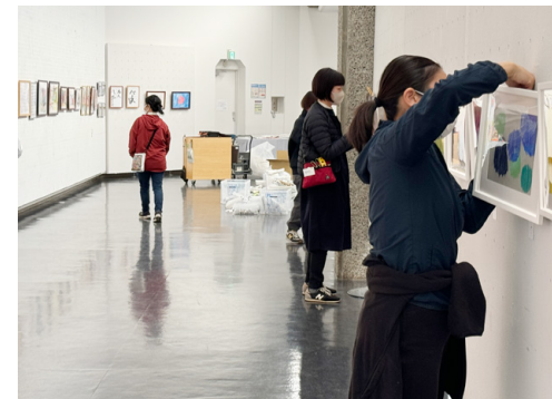
展覧会の設営も学びの場に