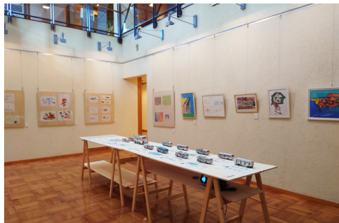
「アートセッションズ in さいほく」