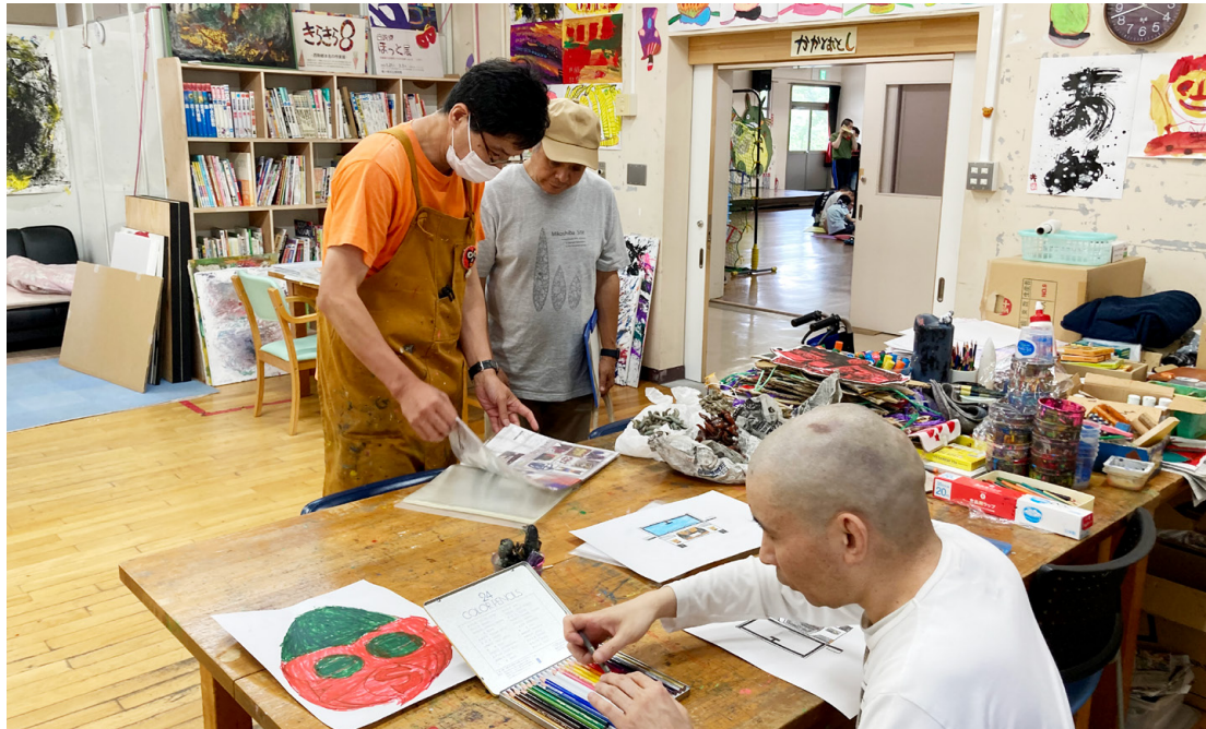
展覧会に向けて、ていねいな取材を重ねる