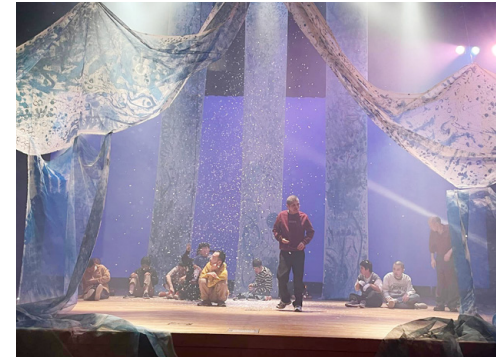
身体表現分野のワークショップ