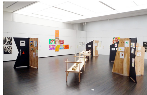
「ザワメキアート展 2021」

運営する社会福祉法人は、県内20事業所で障害福祉サービス事業、介護保険事業のほか、児童福祉施設、障害者スポーツセンターなどを運営。本センターも、障害のある人だけでなく、生きづらさを抱えた人たちにも焦点をあてて活動を広げています。また県内全域に活動を広げるため「ザワメキアート展」の開催を軸に、学校や商業施設での出張展示「ザワメキ・キャラバン」などさまざまな手法で作品を紹介しています。