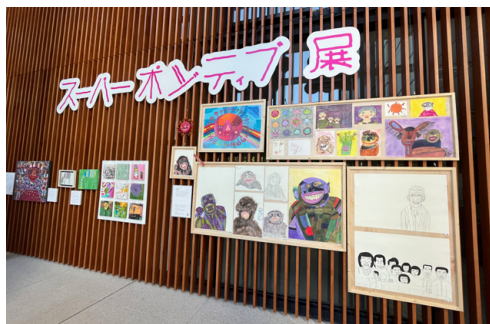
展示・企画サポートを行った「スーパーポジティブ展」