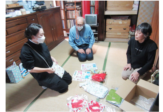
作家の自宅を訪問して相談にのることも

作家本人やその家族から多く寄せられる相談は発表の場に関することです。また企業や病院などから作品の二次利用や展示方法についての問い合わせも。必要に応じて自宅や施設に行き、困りごとを聞きながら解決策を提案しています。美術を学んだスタッフの専門知識も活かし丁寧にサポートすることで信頼関係を築いています。