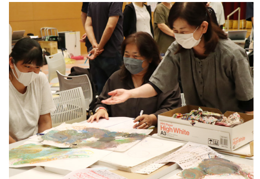
作品について語り合う研修