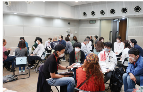
「障がい福祉と芸術文化の関わりを考える勉強会」