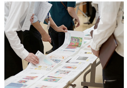
埼玉県障害者アート企画展の選考会

県と行っている「障害のある方の表現活動状況調査」を通し県内に眠るアートの原石を発掘しています。なかには作品かどうかわからない表現も。その調査票をもとに行う「埼玉県障害者アート企画展」の作品選考会では、美術の専門家のほか福祉施設の職員や弁護士、行政職員などさまざまな視点を交えてディスカッションしています。