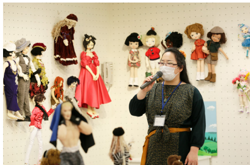
作家が想いを語るアーティストトーク