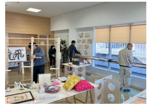
自治体職員や地域の方との展示作業

比企郡嵐山町、入間郡越生町といった自治体による障害のある人の作品展で協働しています。センターの役割として展示会運営のアドバイスや展示レイアウトの提案、什器の貸し出し、SNSによる広報に取り組み、設営作業は一緒に行います。新たな団体や作家と出会い「アートセッションズinさいほく」への出展につながることも。