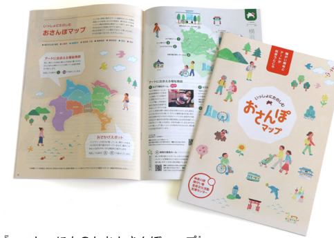
「いっしょにたのしみおさんぽマップ」