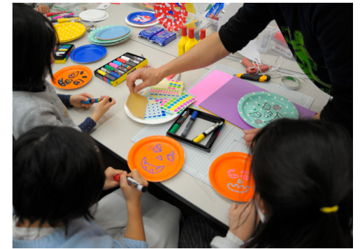
鬼のお面制作ワークショップ

地域の支援体制を広げるため、開設当初より福祉関係者や美術家、デザイナー、教員のほか希望する参加者と「アートカフェミーティング」を定期的で開催。コロナ禍では研修の一環として活用し、現在は各事業所へのアウトリーチにも。これまであまり関わりのなかった福祉事業所の課題を聞き、ワークショップを実施しています。