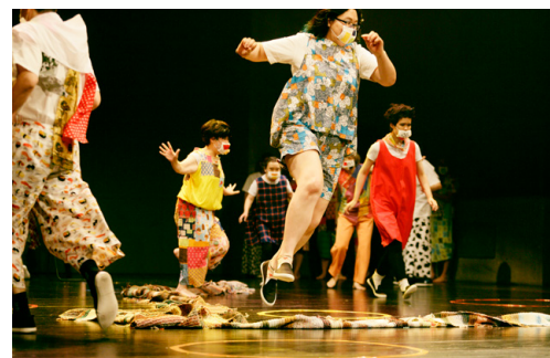
タマップダンス公演 2022