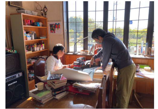
支援者と相談しながら制作することも

「アートセッションズinさいほく」と題した公募展を近隣の障害者支援施設や自治体と協力しながら毎年企画。初めて作品を発表する人も多いため、学校や相談支援事業所からの情報や協力を得ながら作家や家族に会って話を聞き、出展のサポートを行うことも。図書館や観光案内施設など普段から地域の人が訪れる場所で開催しています。