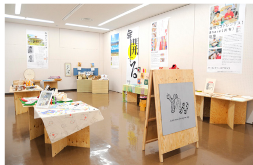
第3回山梨合同企画展「呼吸をするように生まれたものたち PART2」

また「楽しむ」「支える」「深める」というキーワードで障害のある人の芸術文化活動に取り組む県の事業に協力し、舞台公演の鑑賞や展覧会の実施などを通し、障害のある人が芸術文化に親しむ機会を設けています。