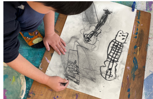
ワークショップでの創作風景

2020年の開設以降、毎年行っている座学の講座や体験型のワークショップではさまざまなジャンルに触れることができます。またセンター設立当初から公募展「うみのもりの玉手箱」を開催。2024年からは、千葉県立美術館を会場に規模を拡大して実施しています。