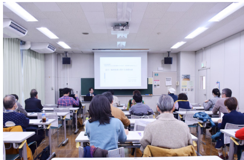
権利保護に関する研修

また、開設当初から障害のある人の作品における権利保護に力を入れ、弁護士による無料相談を定期的で開催。都内各地で行われている障害のある人の芸術活動や鑑賞サポートの訪問調査・発信を積極的に行うほか、活動の場や公募展などの情報はウェブサイトやSNSで随時発信しています。