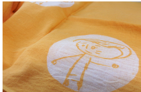
染め物のワークショップ