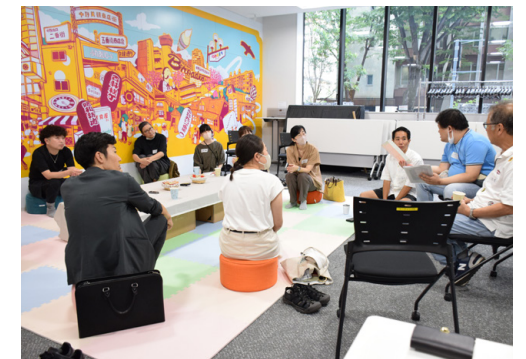
「わぁとなじかん with ライツ」

2023年から障害のある人の芸術活動について自由に交流できる場、コミュニティスペース「わぁとなじかん with ライツ」を開催。これまで障害のある当事者のほか、福祉、アート、行政関係者などの分野から参加がありました。「アート」を軸に安心して自身のことを話せる場、そしてネットワークづくりにつながる場として企画しています。