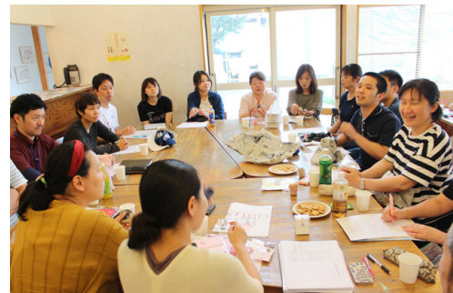
埼玉県障害者アートネットワーク TAMAP ±〇の定例会