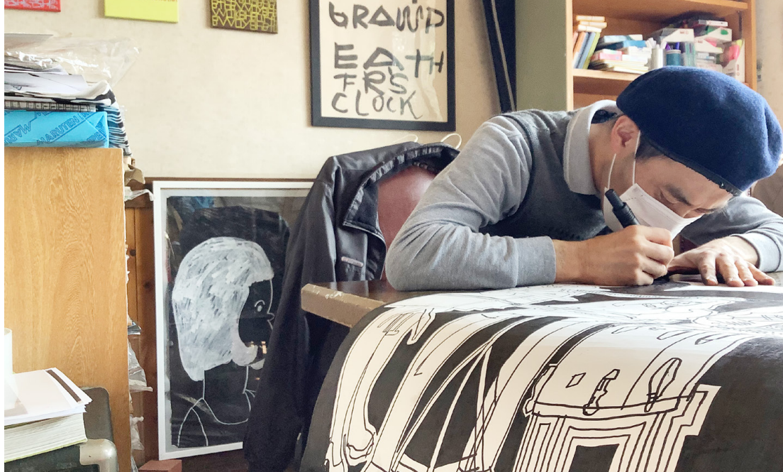
まちこうば GROOVIN' でのアトリエ活動