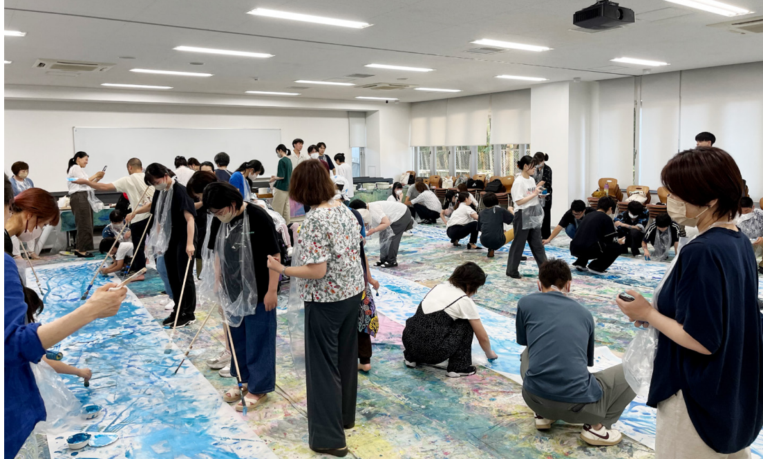
ワークショップ「えのぐと布を使ったドロイング」